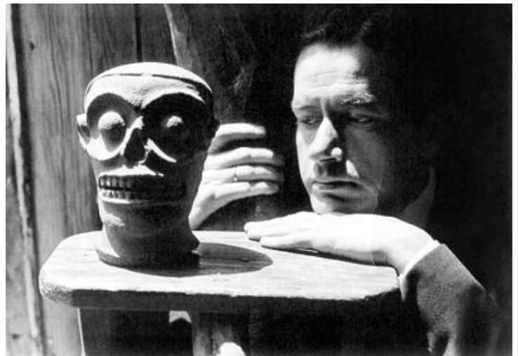
Juan Nepomuceno Pérez Rulfo Vizcaino.

Cien años de soledad fue publicada por primera vez por la editorial Sudamericana en Buenos Aires, con un tiraje inicial de ocho mil ejemplares; es la novela más gustada de Gabriel García Márquez (1927-2014), ha sido traducida a 35 idiomas, incluyendo el persa y el mandarín. En 2007, en el marco